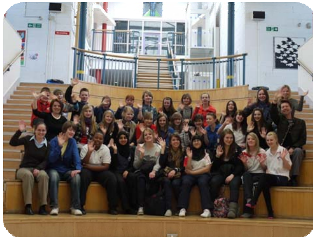
Gruppenfoto im Forum der Schule

Ob es eine Folge des viel beschworenen Klimawandels war oder einfach nur Glück, lässt sich im Nachhinein schwer sagen, aber Fakt ist: Sogar das Wetter spielte mit, als vom 12. bis zum 17. März sechzehn Schülerinnen und Schüler zusammen mit zwei Lehrern unserer Schule im Rahmen des England-Austausches die nordenglische Stadt Bradford besuchten. So konnten die Regenschirme im Koffer bleiben, als die Siebt- bis Zehnklässler gemeinsam mit ihren britischen Austauschpartnern von der Dixons City Academy ein umfangreiches Programm absolvierten: Am Freitagabend holten die Gastfamilien ihre deutschen Besucher vom Flughafen Bradford/Leeds zu einem ereignisreichen Wochenende ab. Während die einen nach York oder Leeds fuhren, erkundeten die anderen die umliegende Natur oder vergnügten sich beim Schwimmen oder Radfahren. Die britischen Gasteltern hatten sich so Einiges einfallen lassen. Eine Familie richtete für die älteren Mädchen sogar eine große Willkommensparty mit traditionellen indischen Köstlichkeiten aus.