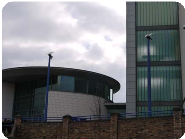
Die Dixons City Academy in Bradford

Sonnenschein und jede Menge Spaß beim England-Besuch der EvR-Schüler